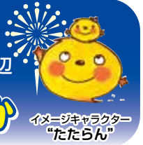
イメージキャラクター 「たたらん」