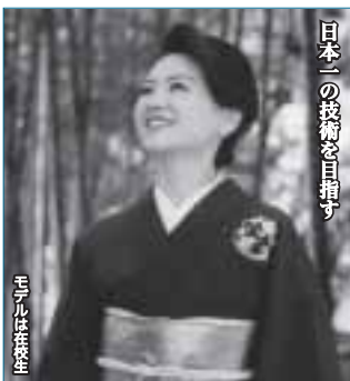
日本の伝統文化を継承する

開講要項 ● 9月生 / 木曜コース 9月17日(木)～ ● 10月生 / 月曜コース 10月19日(月)～ 時間：A(10:00～12:00) B(13:00～15:30) C(18:30～20:30) 定員 / 各時間 20名 応募者には開講日の1週間位前に受講券を送付 受講料 / 無料 但し教材費として期間中5,900円(税込)必要。 会場 / JR川口駅前リリア10階・和室