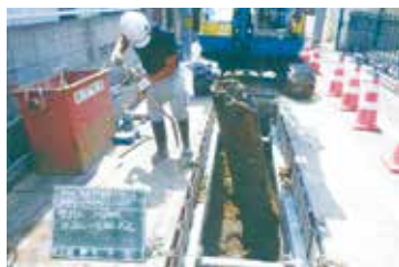
古くなった下水道管の撤去