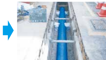
新しい下水道管の布設