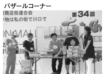
バザールコーナー 商店街連合会 物は私の街で川口で