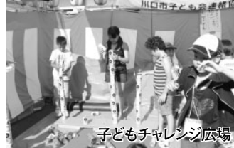
子どもチャレンジ広場