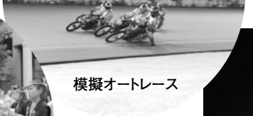
模擬オートレース