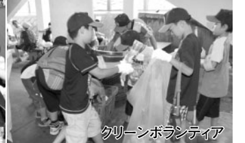
クリーンボランティア