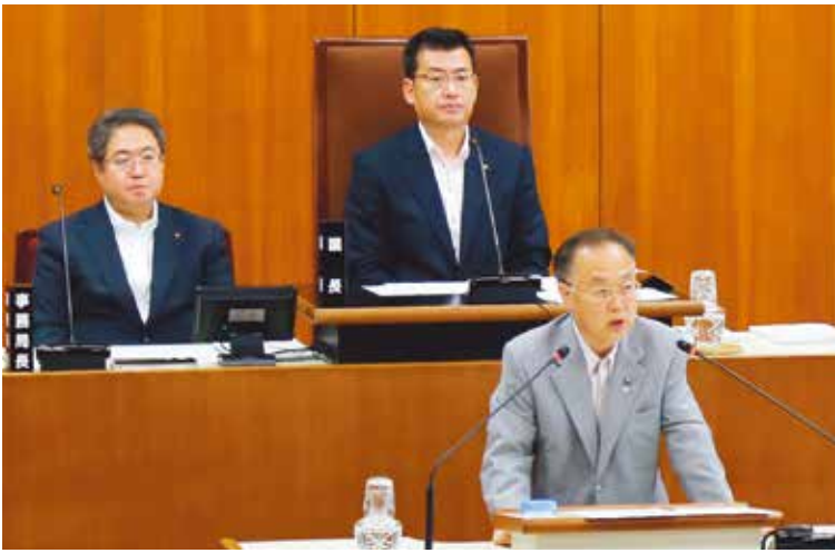
市長の報告と所信

平成29年第2回（6月）市議会定例会は、6月2日から26日までの25日間にわたり開かれました。今回、市長から提出された議案は、追加議案を含め、予算議案3件、条例などの一般議案26件で、審議の結果、いずれも原案どおり可決・承認・同意されました。また、今定例会において副議長が選出されたほか、各常任委員会委員ならびに議会運営委員会の正副委員長および委員の改選などが行われました。