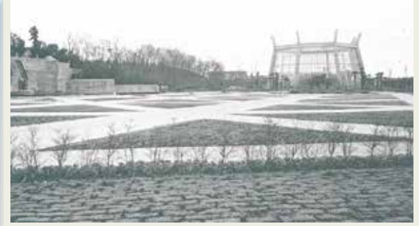
昭和42年 開園当時の花壇広場から大温室をのぞむ