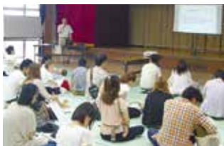
▲パパ・ママのための小児医療講座

妊娠・出産の講義、赤ちゃんの育て方や沐浴の実習ができる「ウェルカムBaby教室」や子どもの病気、急病時の病院へのかかり方を学べる「パパ・ママのための小児医療講座」を実施している他、市民の皆さんが誰でも参加できる市民公開講座を開催し、健康・元気を支えています。