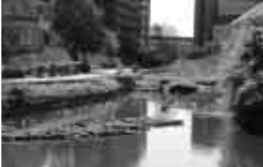
右：植生浮島5つを川の流れに垂直に配置し浄化効果をねらいます。