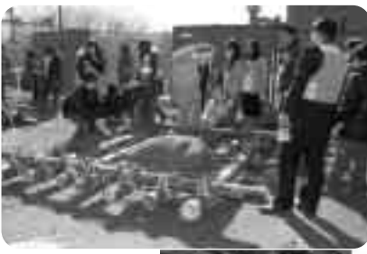
上：懸命に作業をする南小学校の生徒