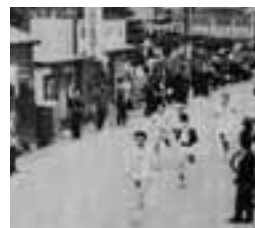
(写真) 市制施行記念として行われた各種行事 右写真：市内一周マラソン。沿道では大勢の市民が応援。 左写真：ブラスバンドの市内パレード。