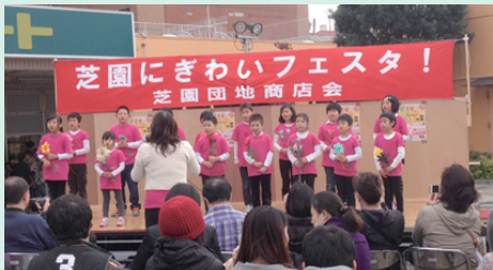
中国人の子どもたちによるコーラス