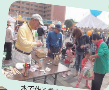
木で作る懐かしいおもちゃ