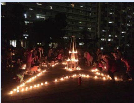
キャンドルナイト