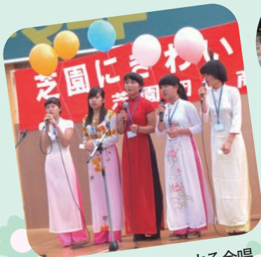
ベトナム人留学生による合唱