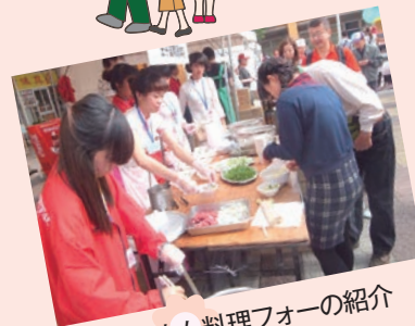
ベトナム料理フォーの紹介