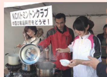
本場中国の手づくりワンタン