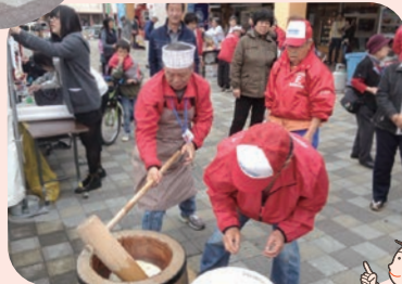
おいしい餅を召し上げ