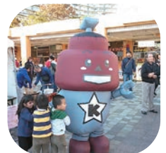
きゅぽらんも 国際交流