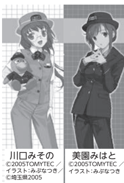
川口みその ©2005TOMYTEC イラスト:あひなつぎ ©埼玉2005 美園みほと ©2005TOMYTEC イラスト:あひなつぎ ©埼玉2005

10月14日の鉄道の日を記念して発売しています。デザインは鉄道むすめ「川口みその」「美園みほと」を起用しています。 日平成26年3月31日(月)まで ※売り切れ次第終了 場埼玉高速鉄道線各駅(赤羽岩淵駅を除く)※郵送販売もあります ¥990円 問埼玉高速鉄道(株) ☎(048)(878)6855