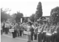
非行防止キャンペーン

青少年の育成にとつて好ましい環境づくりを推進していきます。 〇非行防止キャンペーン 〇愛のひと声・あいさつ運動 〇おかめ市街頭補導 〇青少年健全育成研修会