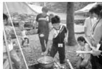
子ども自然体験村

〇子ども自然体験村 〇七つの祝い 〇通学合宿 〇親子の音楽会 〇親・中学生作文コンクール 〇明るい街づくり運動推進大会