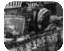
写真左：記念式典で行われた市歌の発表