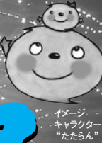
イメージキャラクター「たたらちゃん」