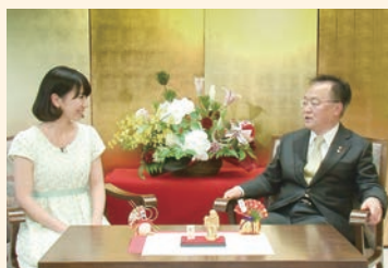
市広報番組「ふれあい川口」1月号で市長年頭インタビューを放送します。 【放送】J.COM川口・戸田 / J.COM埼玉東 1/1(祝)～7(木)12:00～[土・日9:00～] ※市ホームページでもご覧になれます。

向けて、全力で取り組んで参ります。本年も市民本位の政策を推進し、みなさんとともに「川口の元気」をつくっていきたくと考えておりますので、どうぞよろしくお願いたします。