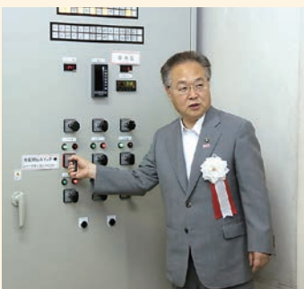
5月28日に行われた、横曽根浄水場小水力発電開始式

これからも引き続き、環境対策や地場産業の活性化などに全力で取り組んで参りますので、市民のみなさん、一緒に川口を元気にしていきましょう。