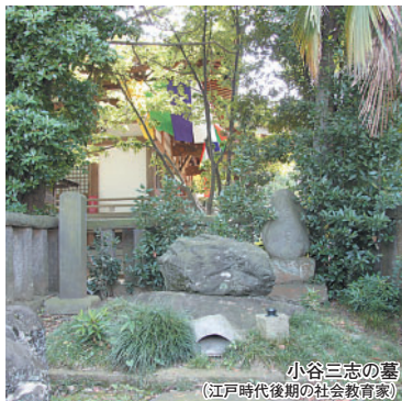
小谷三志の墓 (江戸時代後期の社会教育家)