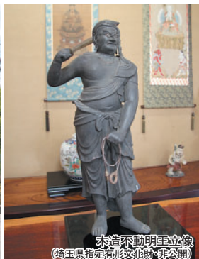
不動明王立像 (埼玉県指定有形文化財・非公開)