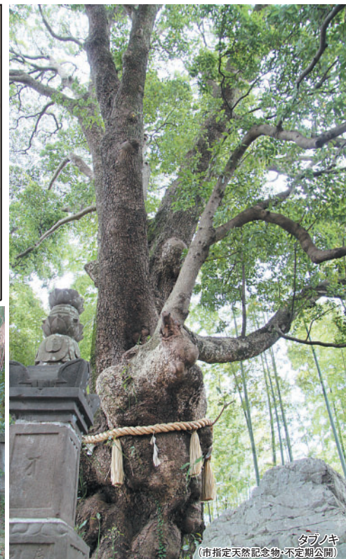
タラノキ (市指定天然記念物・不定期公開)