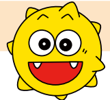
川口市ごみ減量キャラクター「ごまる」