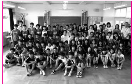
南小学校 6年生のみなさん

は〜とふる訪問は、市内で活躍する企業や個人を市長が訪問し、地域の課題等について意見交換を行い、協働のまちづくりの推進と地域の活性化を図ります。