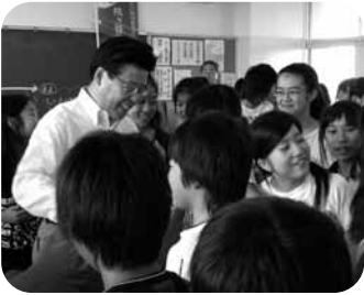
とても有意義な意見交換ができました。ありがとうございました。

皆さんの小さな努力で、川がきれいになりますので、毎日の生活の中で取り組んでほしいと思います。