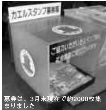
募券は、3月末現在で約2000枚集まりました

問合せ 市産業振興課・内線3331、カエルスタンプ会事務局（市商工会内）☎ 281-5555