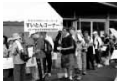
恒例になっているすいとんコーナー。ウォーカーのみなさんに、無料で振る舞われます