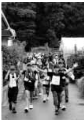
子どもたちも大勢参加します