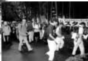
毎年延べ3千人が参加