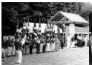
出発式が行われます