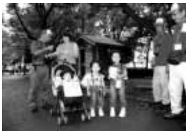
前回の最年少参加者は、ベビーカーで参加