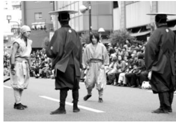
先払いパフォーマンス