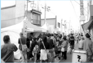
本一通り御成道まつり