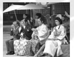
地藏院では茶会が開かれました。▶