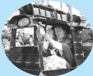
八代将軍徳川吉宗役 松平 健さん

徳川宗家十八代当主徳川恒孝さんと八代将軍吉宗役の松平健さんが行列に参加。時空を超えた対面に大歓声が起こりました。