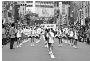
マーチングバンド・鼓笛隊