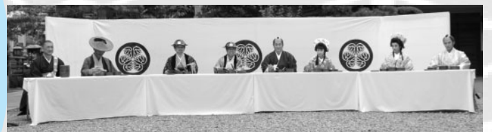
▲錫杖寺で行われた昼食会。 当時の弁当を再現。