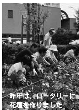
昨年は、ロータリーに花壇を作りました

内容 コミュニティ協議会構成団体による活動発表、展示など 申込みは不要です 問合せ 市コミュニティ協議会事務局(自治振興課内)・内線5522