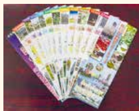
川口市内観光ルートマップ

みなさん、こんにちは。澄み切った青空の下、新緑がまぶしい季節となりました。 5月はレジャーやまち歩きには絶好の季節です。旅行を計画されているかたも多いと思いますが、市内でもゴールデンウィークには、「スプリングフェア2015」がグリーンセンターで、「みどりの地球号in安行」が安行スポーツセンターで開催されます。また、24日には市指定の無形民俗文化財の「安行原の蛇造り」を見ることができ、ぜひお出かけいただきたいと思います。