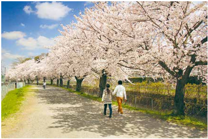
見沼代用水東縁(神根運動場付近)