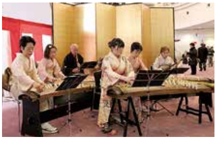
川口市三曲連盟による演奏