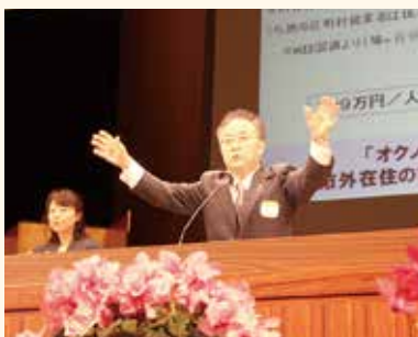
1月6日「新春交礼会」でのあいさつ

この問題を解決するため、医療機関の役割分担にご理解、ご協力をお願いするとともに、ぜひ、みなさんも自分にあった「かかりつけ医」を持つていただき「元気」に暮らしていきましょう。