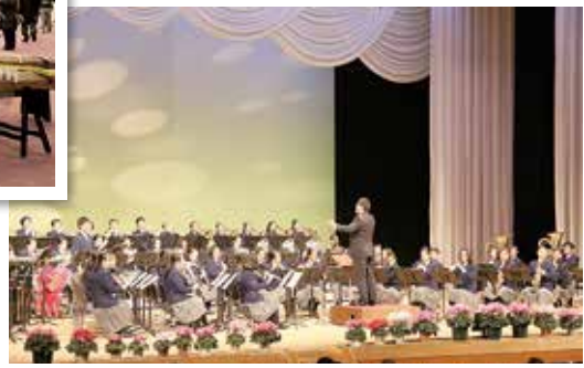
青木中学校吹奏楽部による演奏