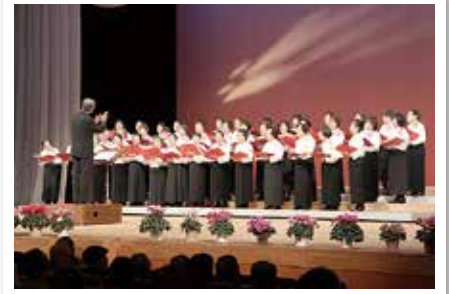
川口市食生活改善推進員協議会による合唱