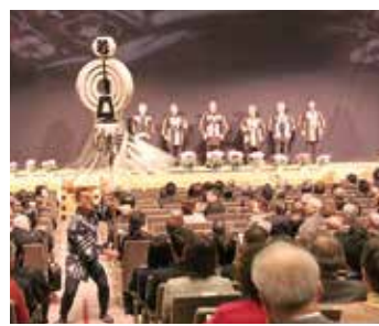
川口 とび 消防組 きやり 木遣保存会による木遣