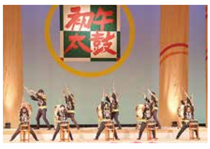
川口初午太鼓連絡協議会による初午太鼓