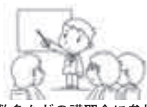
救命救急などの講習会に参加する