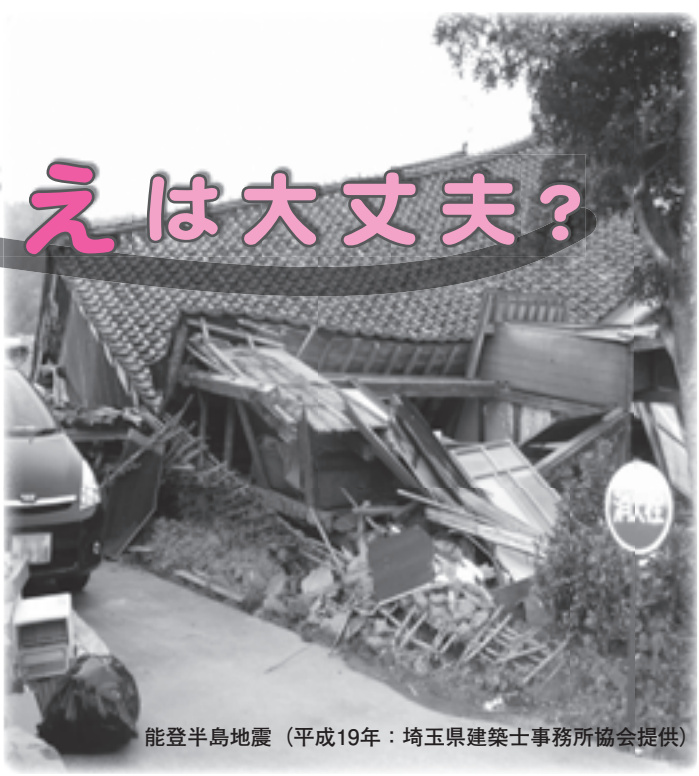
能登半島地震 (平成19年: 埼玉県建築士事務所協会提供)

9月1日の「防災の日」の前に、家族で防災訓練に参加したり、どう避難するかなど話し合ってみましょう。