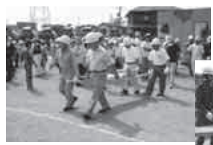
(写真) 昨年の防災訓練のようす 上: 救助訓練

日時 9月6日(日) 午前8時30分~11時 場所 鳩ヶ谷中学校校庭および体育館