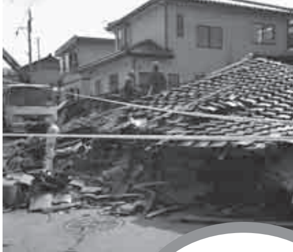
能登半島地震（平成19年）

補助金額 耐震診断費用の2分の1（5万円を限度）または耐震改修費用の23%（30万円を限度）