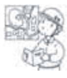
避難経路を決める