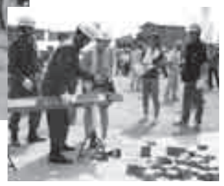
右: チェーンソー操作訓練