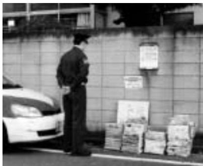
▲パトロールの様子

平日午前5時から9時まで、持ち去りの目撃情報や寄せられた集積所と、その日が収集日となっている地域を、市から委託を受けた警備会社がパトロールを行っています。また、特に持ち去り情報が多く報告さ