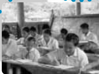
学校で学ぶ ラオスの子どもたち

市民編集長 : 石川 市民編集委員 : 秋山、阿部、池上、熊木、後藤、佐藤、仲川、橋本