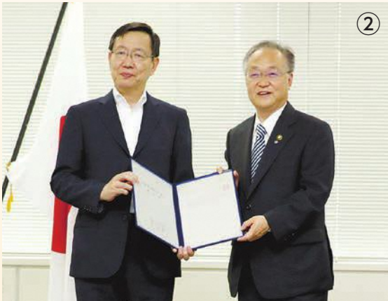
総務大臣(代理)へ中核市指定の申出を行う奥ノ木市長