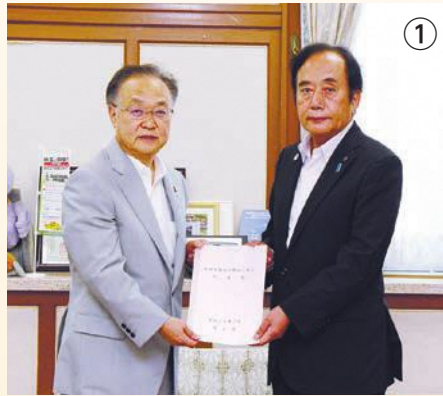
上田埼玉県知事から奥ノ木市長へ同意書の交付