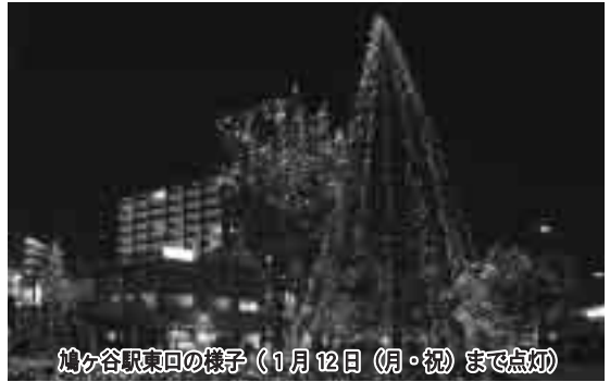
鳩ヶ谷駅東口の様子(1月12日(月・祝)まで点灯)

冬の「縁JOY!はとがやフェスタ」として、東口に施されたイルミネーションのほか、西口にも、地元企業の協賛によりイルミネーションが点灯されました。ぜひご覧ください。