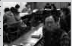
外国人の日本語学習を手助けしています

外国人といても、同じ地域に住んでいる人ですから、お互い認めあって、共生することが大切です。