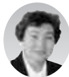
西村喜代子副議長