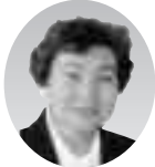
西村喜代子副議長