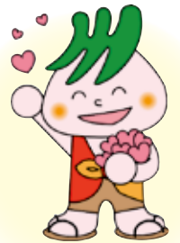
川口市社協マスコット「社助」