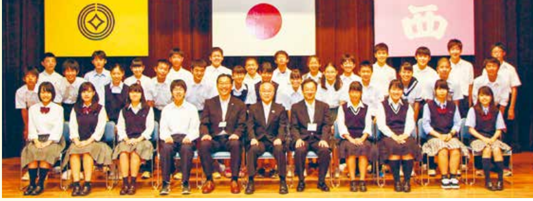
市立中学校26校、市立高等学校3校から選出された34人の代表生徒

将来の川口を担う人材を育成することを目的として、市立中学校、市立高等学校の代表生徒が、市長や選挙管理委員会事務局、産業振興課と、市政の仕組みや有権者として求められる政治的教養、川口の産業について意見交換を行いました。