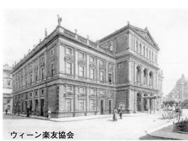
ウィーン楽友協会

楽 聖3人は、音楽史上の頂点に位置する作曲家です。主要作品であるモーツァルトの歌劇「フィガロの結婚」、ベ