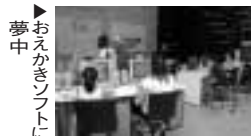
▶おえかきソフトに夢中