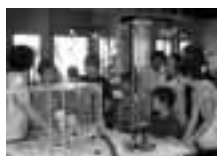
▲真空ってすごい! ミニ実験ショーも人気 ▼ルーペで動植物の標本をじっくり観察