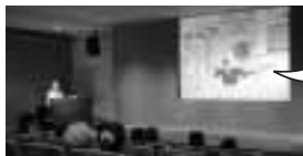
▲くらし探検シアター…映像の中のキャラクター「くらしー」と身近な問題を考えよう