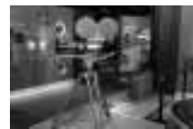
▼貴重な機材や道具などが満載の展示