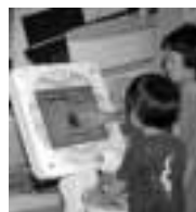
▶くらしー人形をセッとしてクイズスタート!