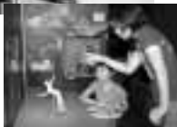
▲人形を自由に動かして3Dアニメ制作