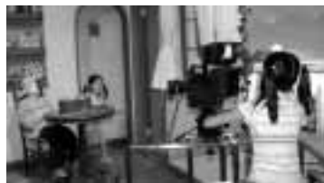
▲私はカメラマン！女優さん、ポーズとって！

いつも見ているテレビや映画。この映像、どうやって作られているのかな？ 答えを知りたいならここ！ デジタル映像制作拠点として、スタジオや編集室、映像ミュージアムや映像ホールを整備。撮影から編集、作品発表まですべて行うことができます。