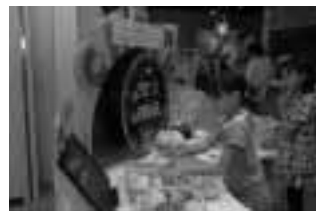
◀重さチェック…制限時間内に目標の重さピッタリに。これが意外と難しい!