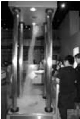
▲わっ!竜巻が現れた!

約40の実験装置がある科学展示室。この装置には、説明書はありません。自分で触れて、試して、そして考えてみましょう。「なぜだろう?」の疑問が解けなかったら、科学館のインストラクターが、一緒に考えてくれます。