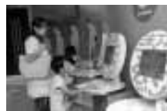
▲契約ゲーム…「コインロッカーに荷物を預ける」のは契約？ 契約じゃない？ どっち!?

家、食べ物、洋服、お金、買い物、ごみ…私たちが普段の暮らしの中にも、知らないことがいっぱい。ここでは楽しいクイズやゲームで、暮らしに役立つ知識を身につけることができます。