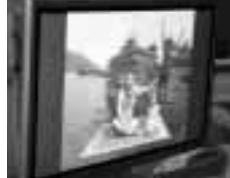
▲普通のじゅうたんに見えるけど…