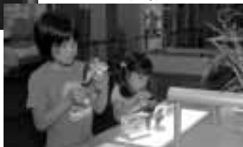
▼左右の重さがつりあうように…あれ?