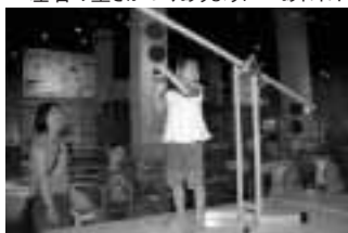
▼インストラクターと一緒に挑戦!