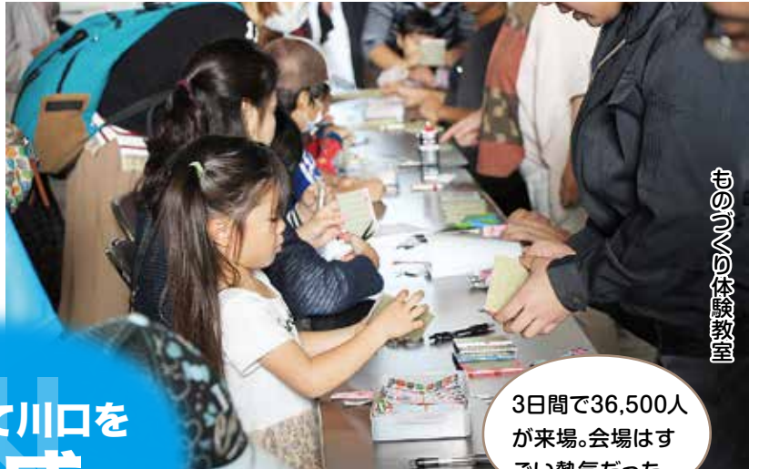
おうちの体験教室