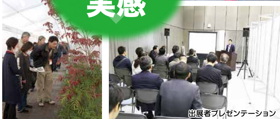
出展者プレゼンテーション