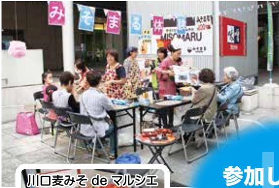
川口麦みそ de マルシエ