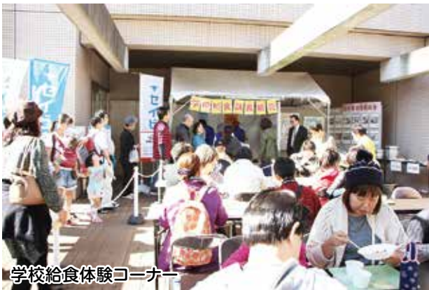
学校給食体験コーナー