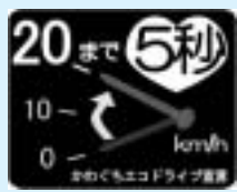
ステッカーは3種類

下の「エコドライブ10のすすめ」 の中で実践できることを宣言して ください。エコドライブを実践す るドライバーが増えれば、その分 CO 2 を削減することができます。 宣言されたか たにはオリジ ナルステッカ ーを差し上げ ます。