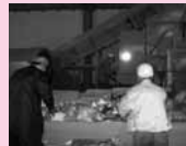
異物取り除き作業