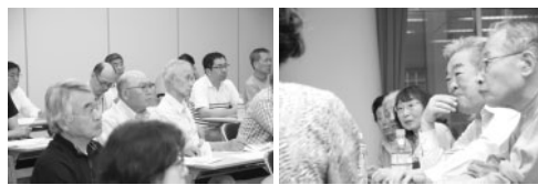
上・左) 昨年の講演会の様子。みなさん、真剣なまなざしで聞き入っていました。