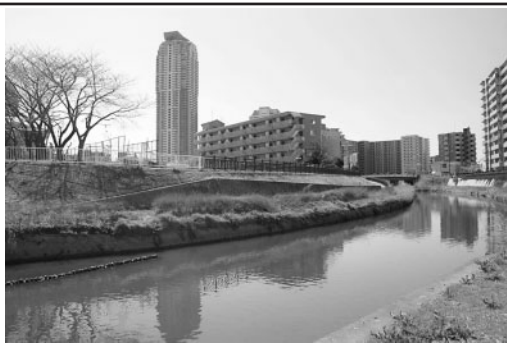
川口の風景 芝川堤 元郷近く

★★★マンションのことに興味をもっていただけるよう わかりやすくお届けしていきます★★★