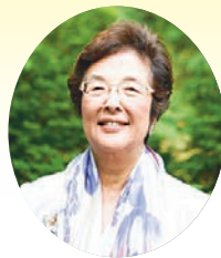
講 師 映画字幕翻訳者・通訳 戸田 奈津子 氏

日 時：11月4日（水） 18：30～20：30 場 所：リリア 音楽ホール ※手話通訳あり 対 象：18歳以上の市内在住・在勤・在学のかた 定 員：600人（応募者多数の場合は抽選） 受講料：500円（当日支払い） 申し込み：9月16日（水）～10月15日（木）に市ホームページの申し込みフォームまたは往復はがきで