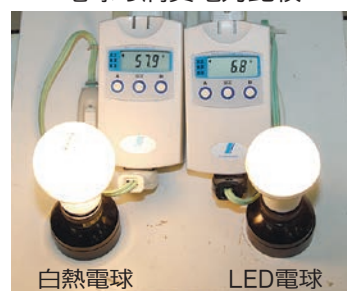
電球の消費電力比較

浅羽 地球高温化の問題は私たち一人ひとりの生活に深く関わっています。センターではみなさんのエコの取り組みを積極的に伝えていきますので、情報をお寄せください。みんなで一緒に地球高温化問題の解決に取り組んでいきましょう。 市長 環境問題は地球規模で考えて、足元から行動し、一人ひとりが気をつけて実践していくことが重要です。みなさんと一緒にこれからは頑張っていきたいと思ひます。今日はありがとうございました。