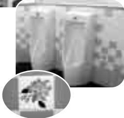
写真右：壁には、桜町小学校にちなみ「桜の花のタイル」を貼りました

5・6年生の代表8人の児童と校長先生等で「みんなで作るトイレ検討委員会」を設置し、アンケートを取りまとめ、市担当者や設計工事業者を交えて意見交換を行い、全体が明るく清潔感のあるトイレを目指しました。 会議では特に「臭い・汚い・暗い」というイメージをどうしたら解消できるのかを考え、ピンク、青、赤などみんなの好きな色を取り入れた壁や扉にした結果、委員は「想像した以上に明るく清潔感のあるトイレができ、とても嬉しいです。」と話してくれました。 今後みんなのトイレとして、大切に使用してほしいですね。