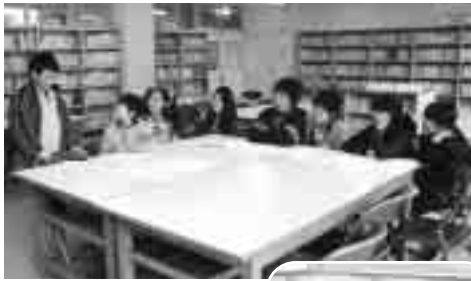
写真上：委員の子どもたち