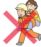
自然災害・火災への 対策や救助活動