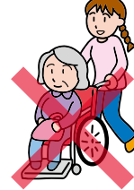
老後などへの 公的支援

本市の市税収納率は、県内市町村で下位に低迷しています。そのため、税金を完納している多くのかたとの公平性を考慮し、督促状・催告書の送付・納税相談を行った後でも、納税されないかたに対し