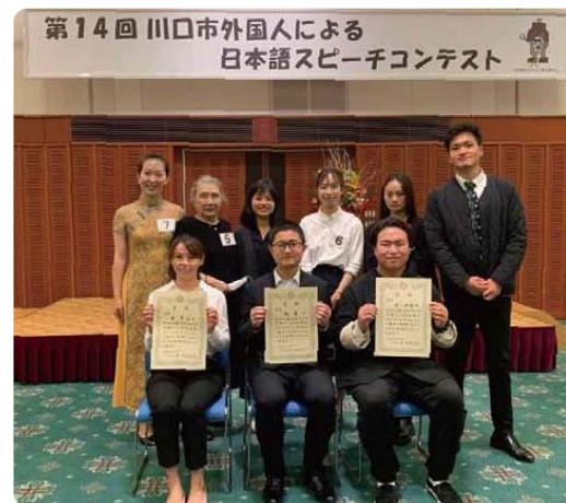
※写真は「第14回川口市外国人による 日本語スピーチコンテスト」の様子です。

川口市 市民生活部 協働推進課 多文化共生係 〒332-0015 川口市川口1-1-1 キュポ・ラ本館棟 M4階 電話:048-227-7607 FAX:048-226-7718