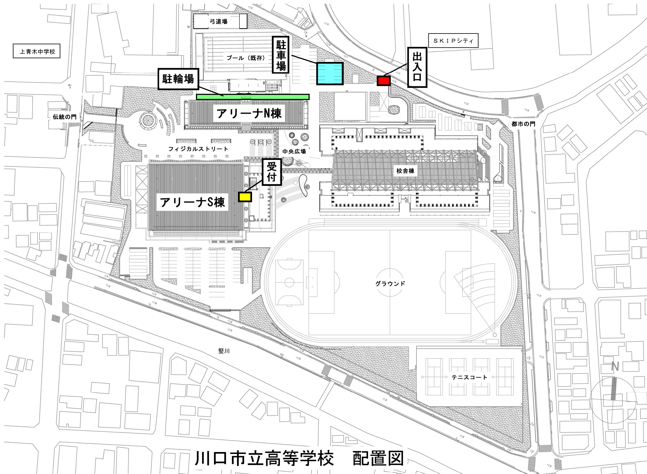
川口市立高等学校 配置図