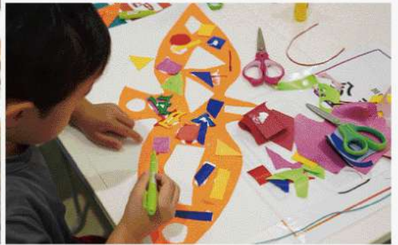
2025年に開催した市民とつくる渡り鳥アートプロジェクトの様子