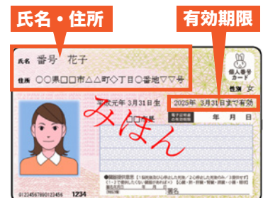
■ マイナンバーカード表面

外国籍住民の方のマイナンバーカードに記載される内容は、在留カード、特別永住者証明書に記載されている氏名、住所、生年月日、性別と一致するため、漢字・アルファベット氏名、通称名などの追加、永住権の取得、在留期限の変更などがあれば、市役所窓口でマイナンバーカードへの追記・変更が必要となります。