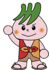
川口市社協マスコット「社助」

「川口市生活自立サポートセンター」は、働きたくても 就職活動が上手くいかない、将来が不安など、 経済的な問題と併せて生活上のさまざまな問題に 直面しているかたの支援を行う窓口です。