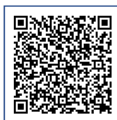
川口市ホームページ