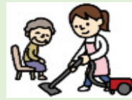
生活支援サービス