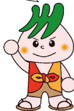
川口市社会福祉協議会マスコット 社助（しゃすけ）