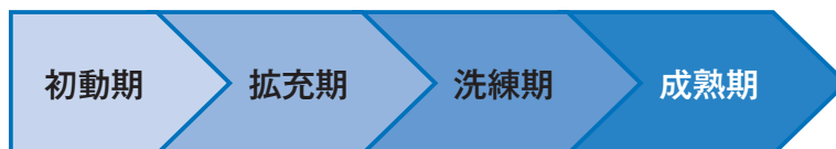
図表-7 事業のプロセス

事業の立ち上げは「初動期」であり、その後取組を広く充実させていくための「拡充期」、取組の質をさらに向上させる「洗練期」、内容を深め成熟させていく「成熟期」となります。